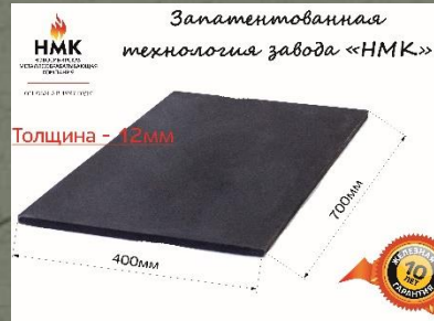
ПС-0 плита сплошная