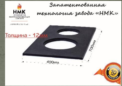
ПС-2 с 2-мя конфорками